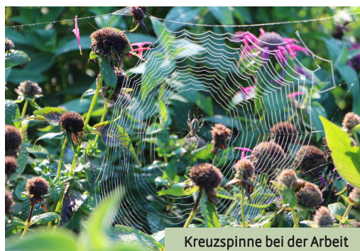
Kreuzspinne bei der Arbeit