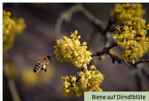
Biene auf Dirndlblüte