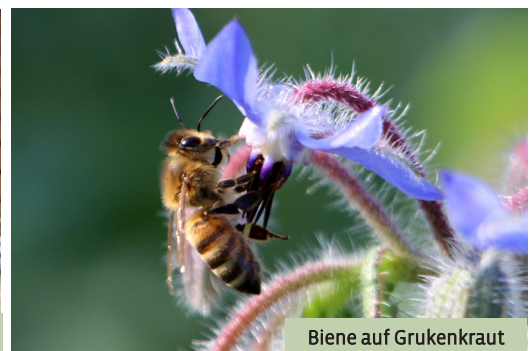
Biene auf Grukenkraut